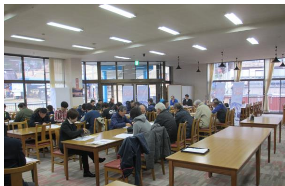
従業員の打合せ会議にて安全教育を実施