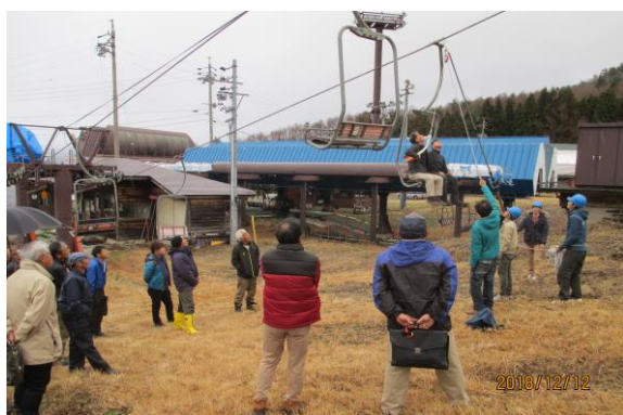
リフト従業員とパトロールによる救助訓練