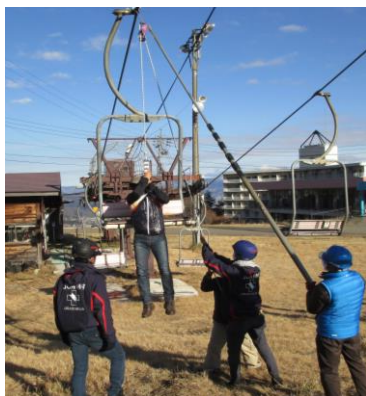
リフト従業員とパトロールによる救助訓練