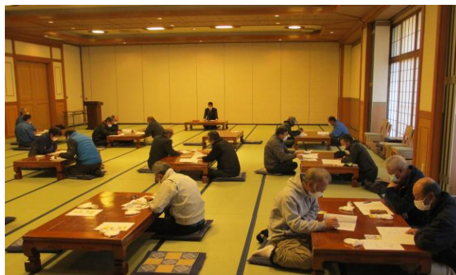
従業員の打合せ会議にて安全教育を実施